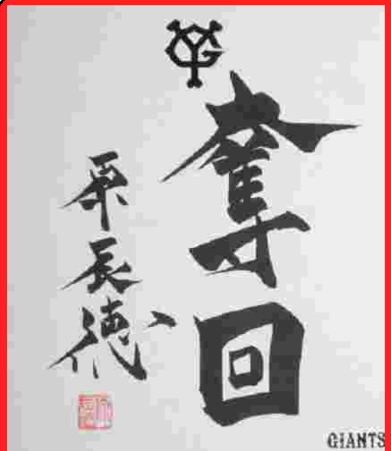
巨人軍・原 辰徳監督サイン