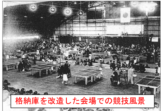
格納庫を改造した会場での競技風景

昭和 20 年の敗戦からまもない 21 年、第 1 回国民体育大会が近畿地方を会場に開催されました。その 3 年後の昭和 24 年には東京や神奈川などを会場にして第 4 回大会が開催されます。この大会から開会式に天皇・皇后陛下の御臨席を仰ぐ事になります。秋季大会は 10 月 30 日から 11 月 3 日までの 5 日間の日程で競技が始まりました。この大会では陸上や相撲等 27 種目が行われ、卓球の会場として南千住 10 丁目の「都立城北工業学校」現在の汐入にある「都立産業技術高専荒川校」【地域では航空高専が一般的呼び名】の格納庫が選ばれました。戦後間もないため修繕もできず、建物は大部分が傷んでおり当時の金額で 260 万円の予算で瀟洒な体育館として生まれ変わらせ、活用した模様です。参加した選手・役員は北海道から鹿児島まで 1 地区 20 名位の参加、合計 9 3 3 名が汐入に集合し熱戦を繰り広げました。10 月 31 日から 2 日間は高校男女・3 日目は一般女子・4 日目は一般男子の日程が組まれ、一般男子は神奈川、一般女子は京都、高校男子は北海道・女子は香川が優勝しました。時間は午前 9 時～午後 4 時までの競技大会となりました。昭和 24 年の南千住は夏には美空ひばりの公演もあり【1 月号で掲載】さぞや賑わった事でしょう。それにしても、戦後間もない頃で生活も大変な時代。当時の日本人はたくましいですね。