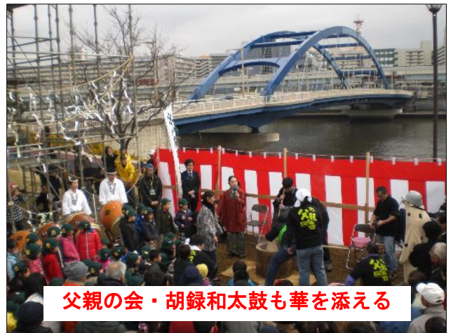
父親の会・胡録和太鼓も華を添える

完成式典は3月20日（日）11時からの予定です。塔は3年後には解体される事になっていますが、その時は解体についての議論が行われるのでしょうか。私としてはこの塔の完成に伴い、是非、公園内の安全・安心の確保から防犯カメラを取り付けることを関係者に提案をしています。更にライトアップが出来れば暗がり対策と一石二鳥です。今、公園の中は「河津桜」が満開。区長は式典の中で、汐入周辺の隅田川に「人口の渚」の創設を提案しています。汐入公園周辺は新しい観光スポットになる可能性の秘めた場所です。 ボランティアの応募は090-6149-0399へ