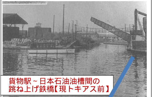
貨物駅～日本石油油槽間の 跳ね上げ鉄橋【現トキアス前】