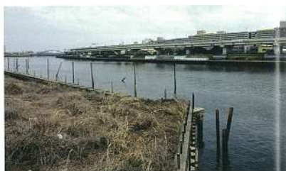
墨田の渡し跡「白鬚橋付近」

今から 1200 年前、奈良時代の幹線道路は 12m の幅で全国に広がっていました。南千住は「古代東海道」として整備され、茨城県まで通じていました。国府台は下総国の県庁です。