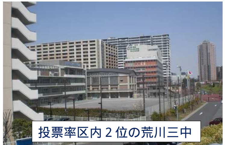
投票率区内2位の荒川三中

12月14日に衆議院議員選挙の投開票が行われ、荒川区においては32カ所の投票所で実施されました。今回荒川区の有権者数は2年前より3000票増え16万3,000票。有権者の関心の度合い、投票行動を表す投票率について、当日は荒川区全体では53・73%の87,000票でしたが、この中で注目すべきは汐入地区の投票率の高さでした。