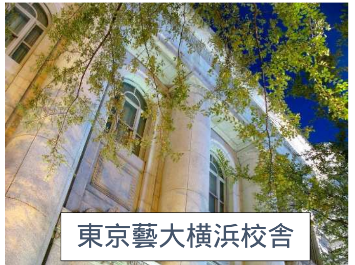
東京藝大横浜校舎

現在横浜市内に点在している、東京芸術大学大学院研究科の3校舎の移転が急務になってきました。これは2020年の東京オリンピック・パラリンピックに間に合わせる為、新たに横浜ベイブリッジの近くに大型客船棧橋が建設されることになり、その影響で校舎を平成28年までに移転するよう求められているために