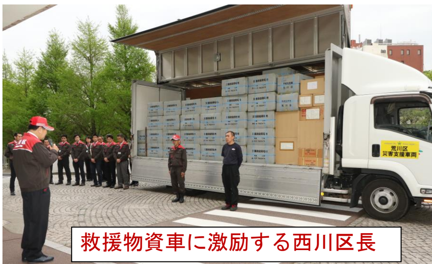
荒川区長が救援物資車に激励する

連日の報道にもあるように、「熊本地震」。被害は日ごとに増え続け 10 万人近くの方が避難生活を余儀なくされています。荒川区は熊本県からの要請により、18 日午後 5 時現地に緊急物資を搬送するため区長の指揮のもとに区役所前で第 1 陣の出発式を行いました。荒川